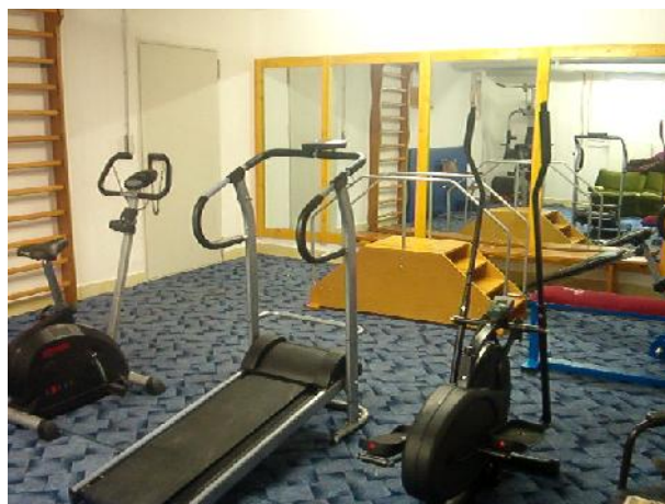
Sală fitness și psihomotricitate

Acest pavilion este operațional și pentru comunitate realizându-se astfel nu doar integrarea persoanelor cu nevoi speciale în societate dar și apropierea societății, comunității de aceste instituții de ocrotire.